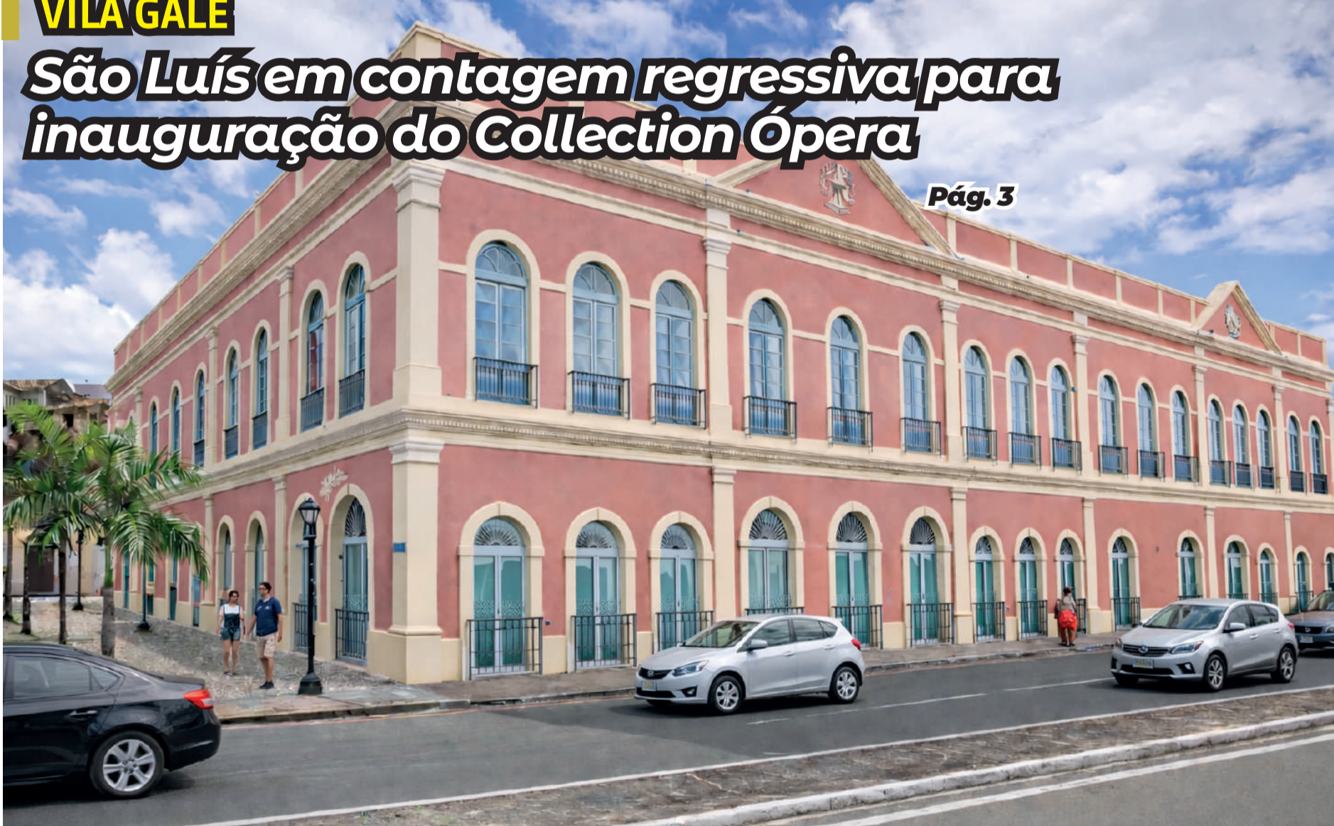
Vila Galé Collection Ópera irá fortalecer a hotelaria local e enriquecer a arquitetura colonial no Centro Histórico de São Luís