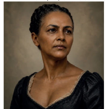
Escritora a partir da imagem do seu busto da Praça do Panteon

Um importante achado na Hemeroteca Digital da Biblioteca Nacional traz novos elementos para a compreensão da recepção contemporânea de Úrsula, romance publicado em 1859 por Maria Firmina dos Reis e hoje reconhecido como um marco da literatura brasileira. Pág. 6