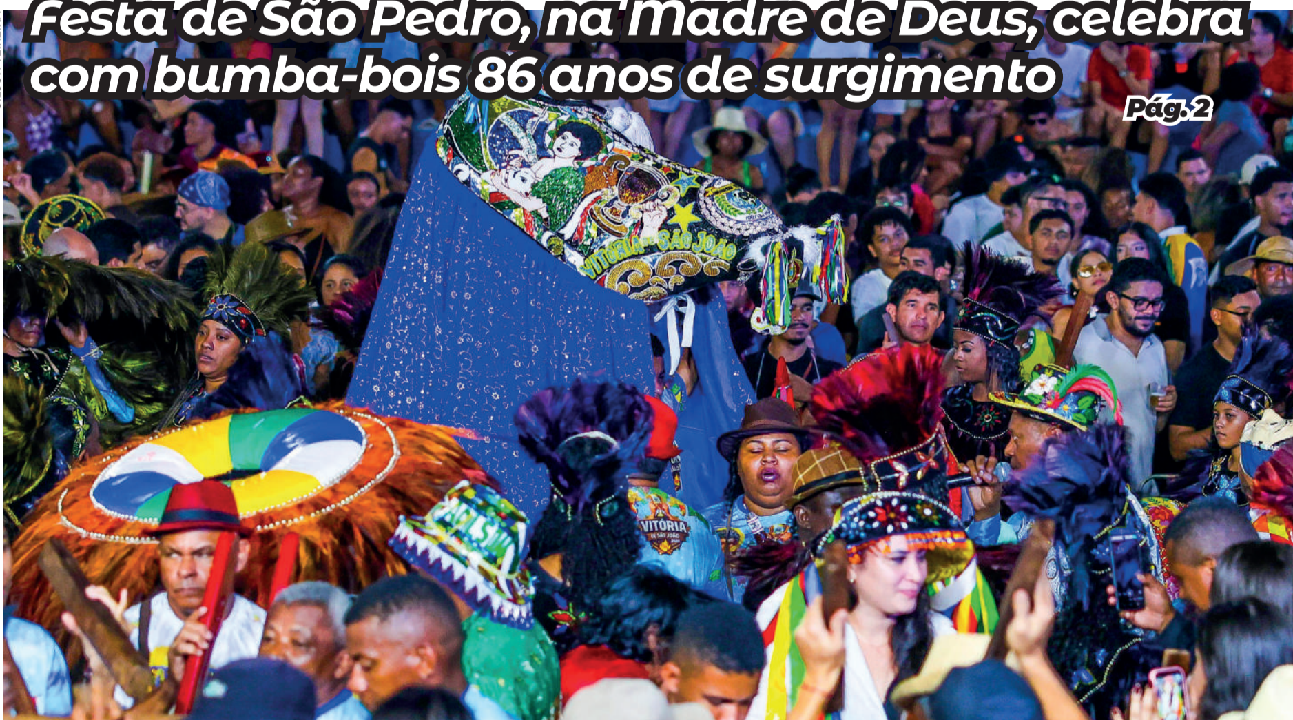
Mesmo com dificuldade de passar pela multidão, o Boi vai pelo ar para louvar São Pedro mais de perto