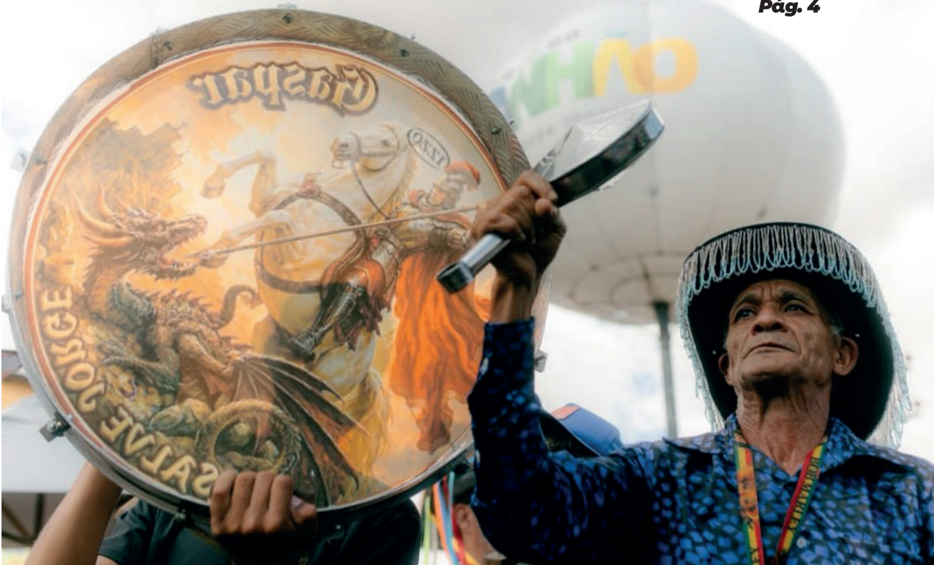
Um espetáculo a céu aberto para reverenciar São Marçal em uma das mais autênticas manifestação do folclore maranhense, o Sotaque de Matraca