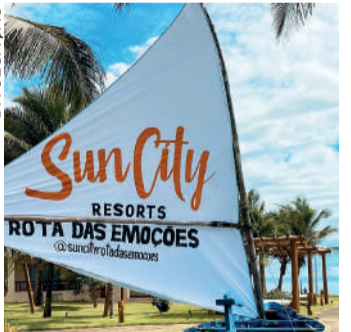
Hotel Sun City Rota das Emoções