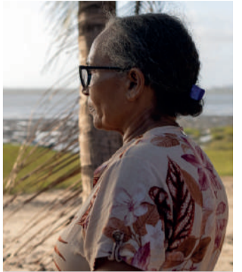
Porto & Pesca será inaugurado hoje em São Luís