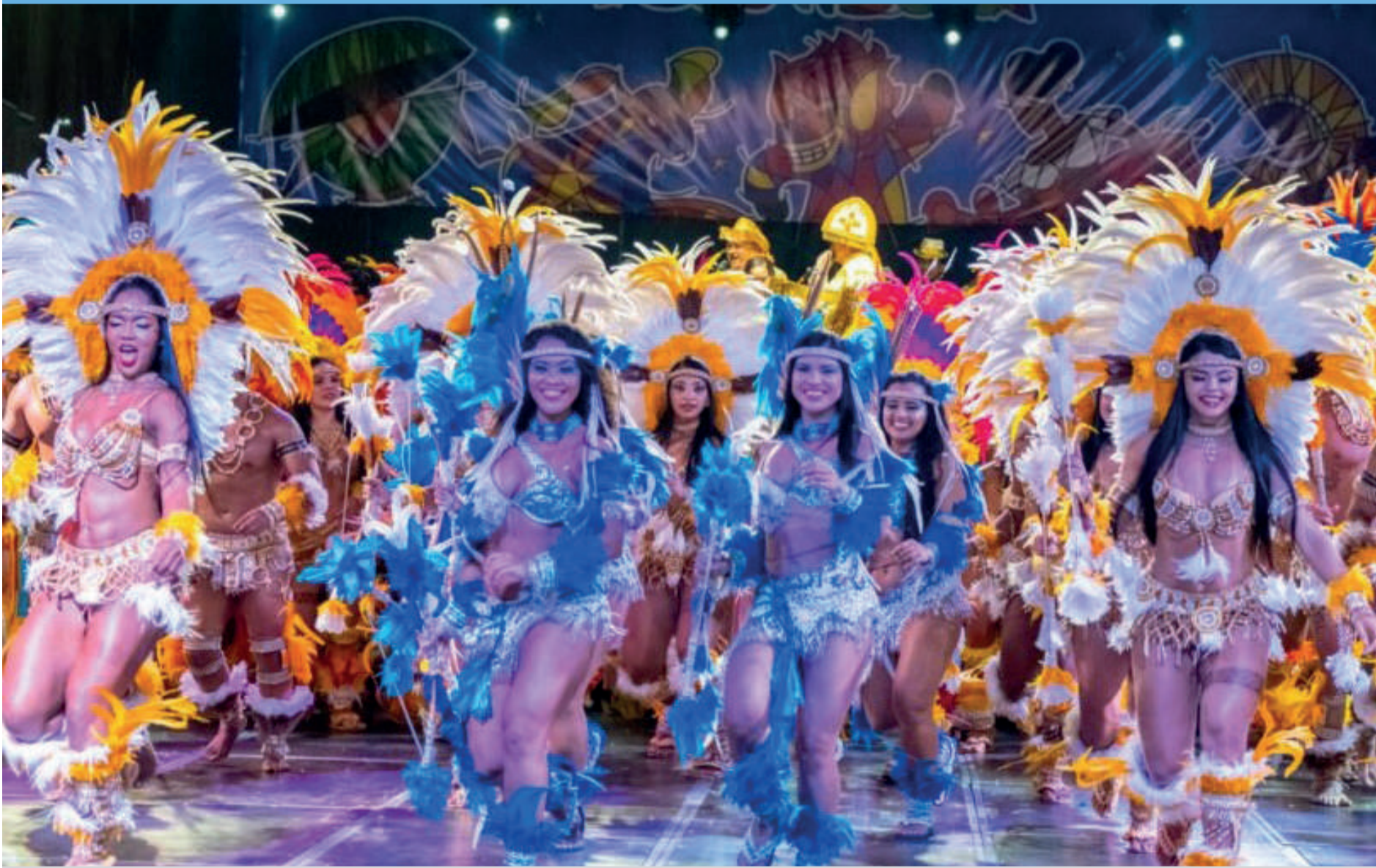
Uma tradição maranhense que se tornou um dos mais ricos e aclamados folguedos nacionais