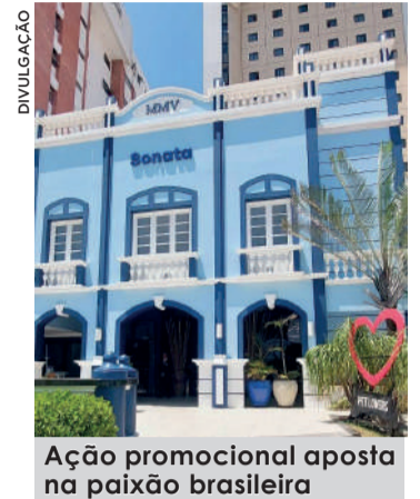
Ação promocional aposta na paixão brasileira