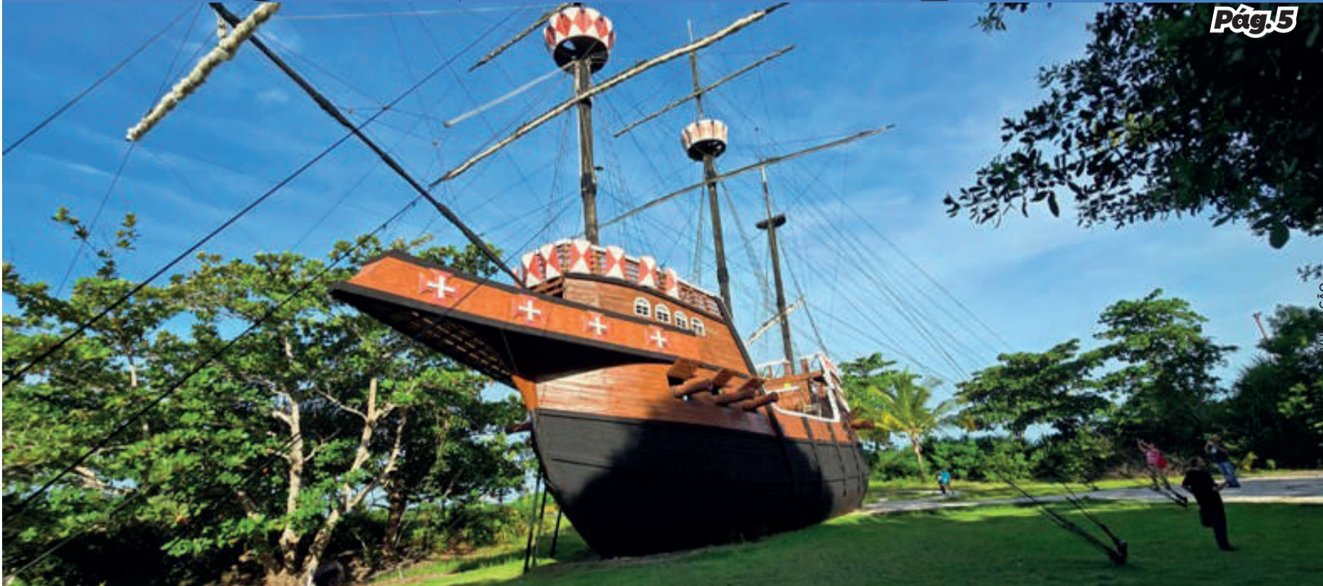
A réplica da Nau Capitânia gera curiosidade e encantamento