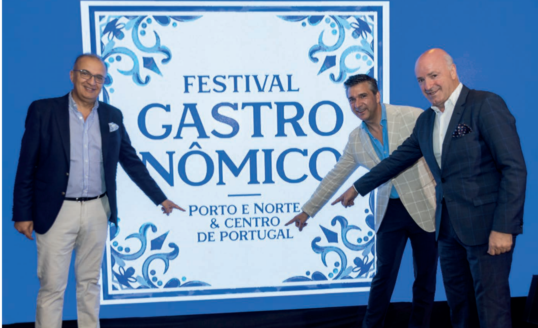
Luís Pedro Martins, presidente do Turismo do Porto e Norte de Portugal; Rui Ventura, presidente do Turismo do Centro de Portugal; e Jorge Loureiro, vice-presidente do Turismo do Centro de Portugal, durante a abertura do Festival Gastronômico do Porto e Norte & Centro de Portugal, em Belém