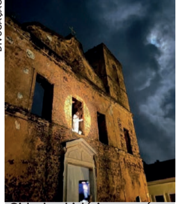
Cidade histórica será o cenário das encenações