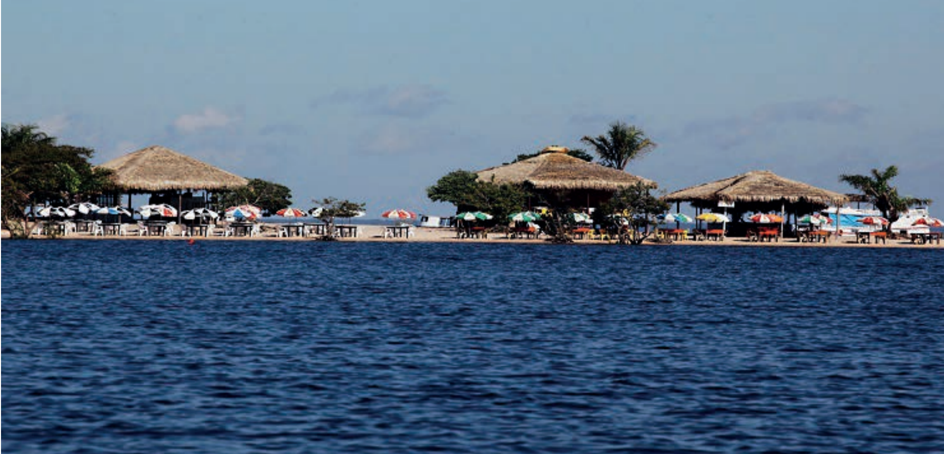
Praias de água doce, areia branca e paisagens deslumbrantes ao longo do Rio Tapajós